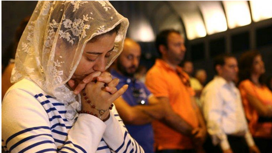
Amenaza a los cristianos de siria.