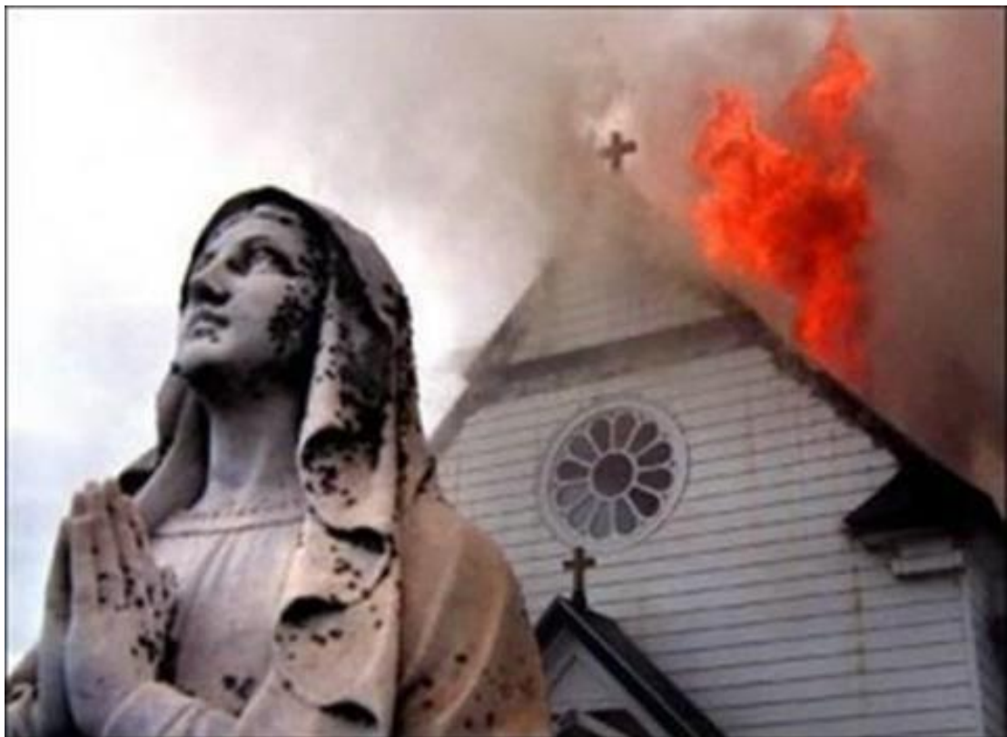
Iglesias incendiadas en siria.