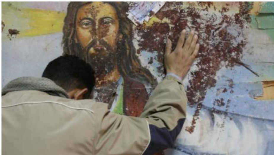
Cristianos perseguidos en egipto.