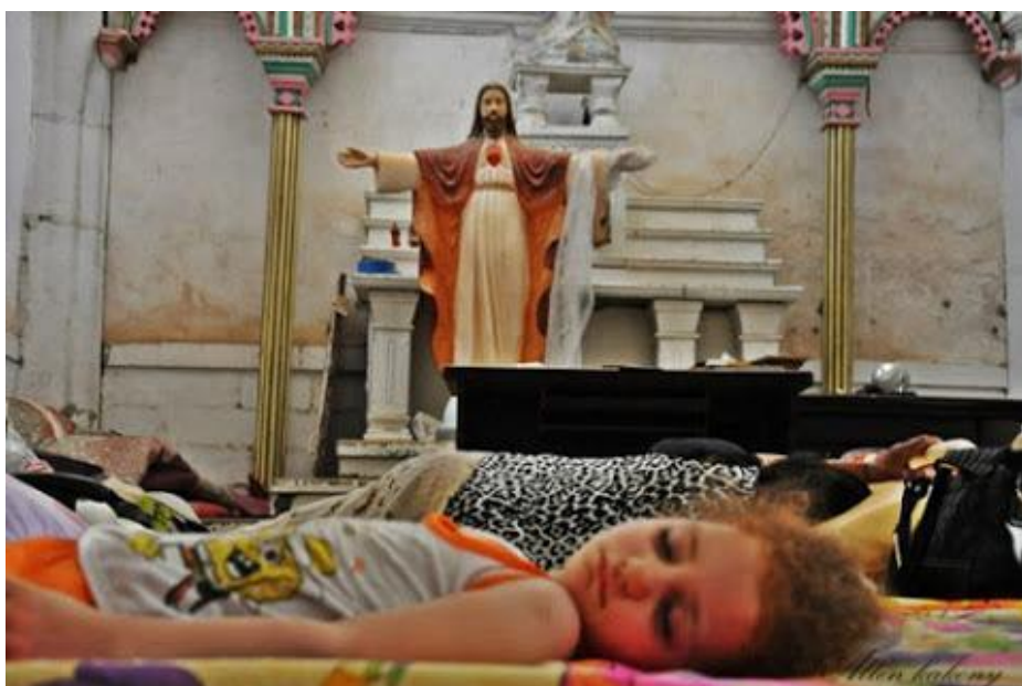
Niños cristianos en una iglesia iraquí.